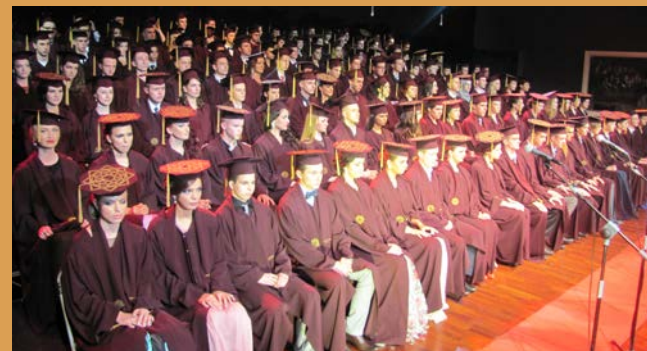
"Obrazovanje je zlatni ključ slobode i uspjeha."