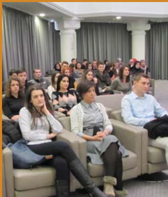
PODRŽITE MLADE U BOSNI I HERCEGOVINI U OBRAZOVANJU I NAUCI