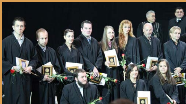
Prosječna ocjena stipendista u akademskoj 2016/17. g. iznosila je 9,41