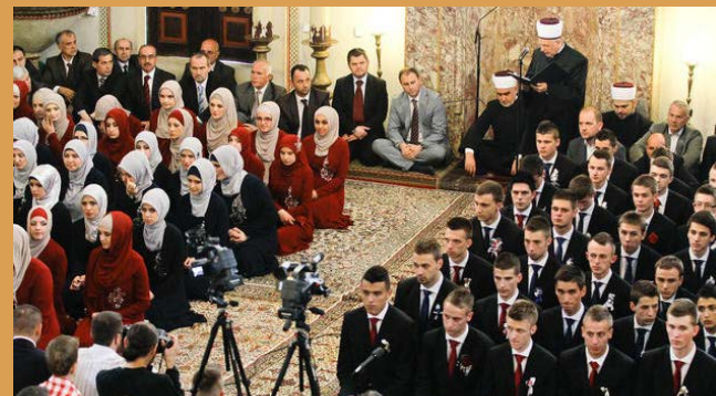
"Znanje je vaša izgubljena stvar, gdje god da ga nađete uzmite ga."