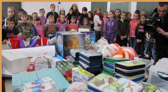
Našom pomoći obuhvaćeno je preko 1.850 učenika povratnika u Republiku Srpsku.