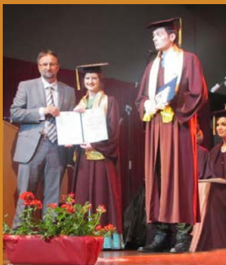
ZALOŽITE SVOJE DOBRO ZA OPĆE DOBRO