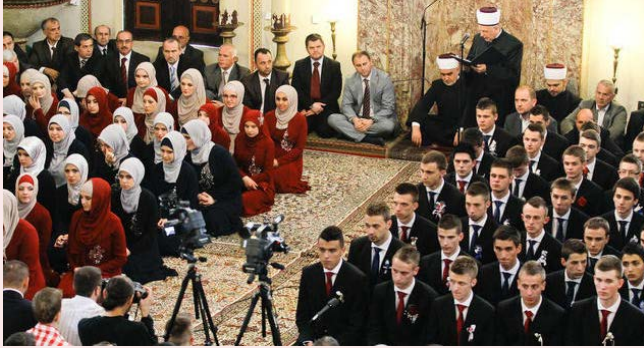
“الحكمة ضالة المؤمن أينما وجدها أخذها.”