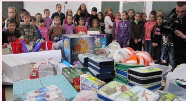
شملت مساعدتنا إلى الآن 1850 تلميذ عائد إلى الكيان الصربي.