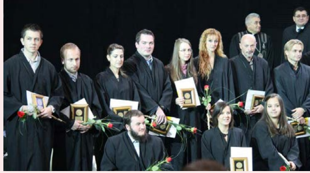
في العام الجامعي 2016/2017 م، يبلغ متوسط تقدير الطلاب 9,41