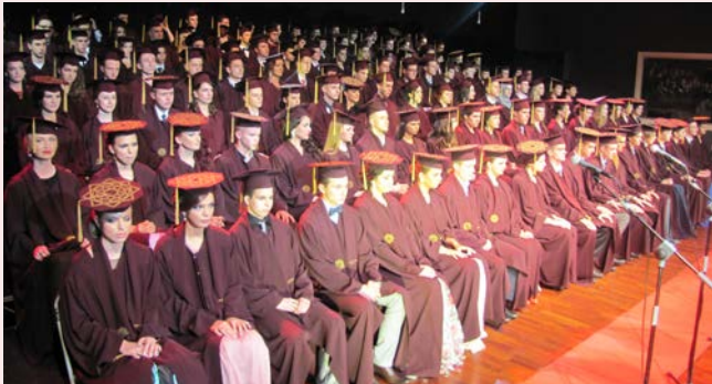
“يمثل التعليم المفتاح الذهبي للحرية والنجاح.”