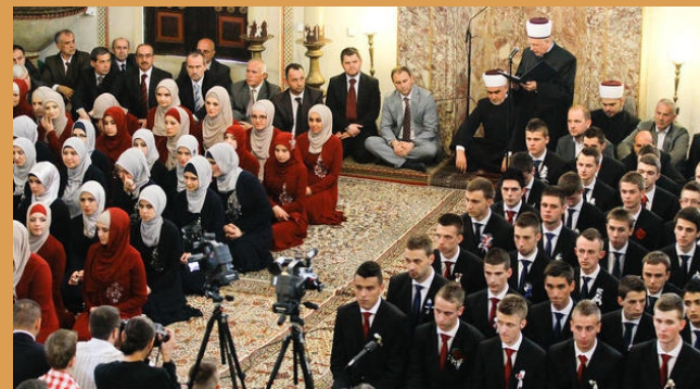
"Znanje je vaša izgubljena stvar, gdje god da ga nađete uzmite ga."