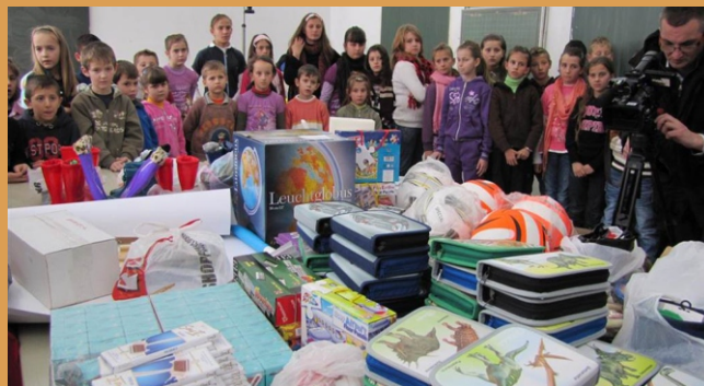
Našom pomoći obuhvaćeno je preko 1.700 učenika povratnika u Republiku Srpsku.