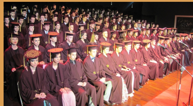
"Obrazovanje je zlatni ključ slobode i uspjeha."