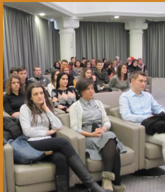
PODRŽITE MLADE U BOSNI I HERCEGOVINI U OBRAZOVANJU I NAUCI