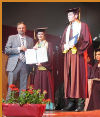
ZALOŽITE SVOJE DOBRO ZA OPĆE DOBRO